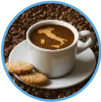
il caffè .

mare • cucina • vino • pizza • caffè • moda • arte • musica • cinema